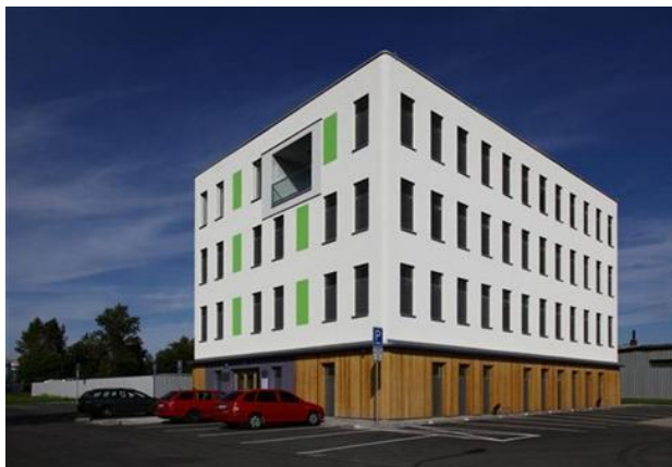
Školící středisko Otazník – budova firmy Intoza, 1. pasivní administrativní budova v ČR